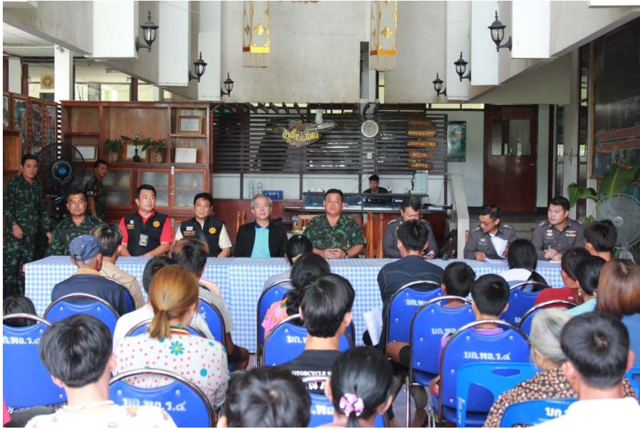
สั่งอบรมในค่ายทหาร! ตร.จับเด็กแว้น 19 ราย เข้าอบรมปรับพฤติกรรมและทัศนคติ