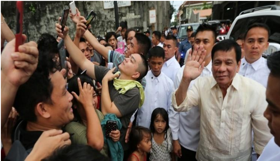
สงครามยาเสพติดฟิลิปปินส์