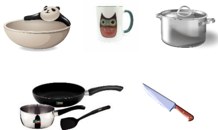
หมวดห้องครัว